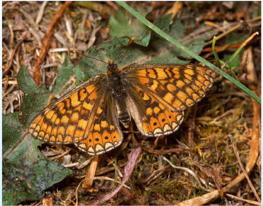
Euphydryas aurinia .

In Piemonte Coenonympha oedippus è localizzata principalmente nei residui ambienti di brughiera.