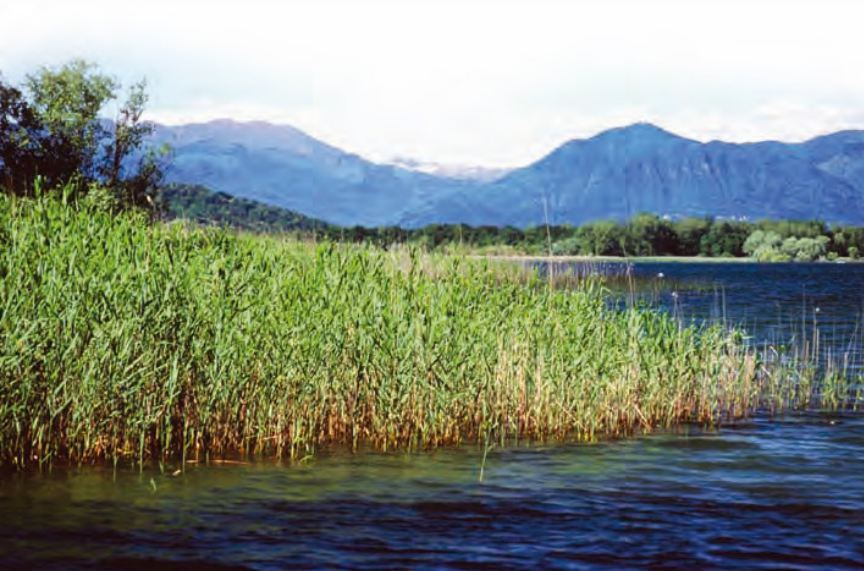
Una vista del canneto.